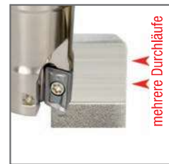
keine Markierungen auf der bearbeiteten Schulterfläche mehrere Durchläufe

Die hervorragende Leistung unserer neuen RekPlus Produktpalette zu einem erstaunlichen Preis.